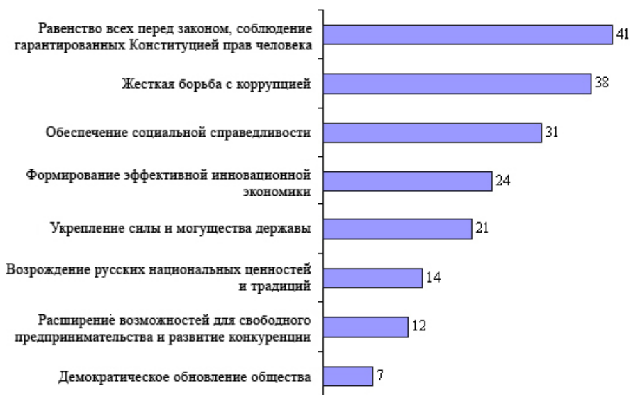
Рис. 1. Какая идея должна стать ключевой для модернизации России (2010 г.), % (допускалось два варианта ответа)

Как видно на рис. 1, наибольшее количество сторонников в качестве ключевой для российской модернизации идеи набирает идея соблюдения прав человека, равенства перед законом.