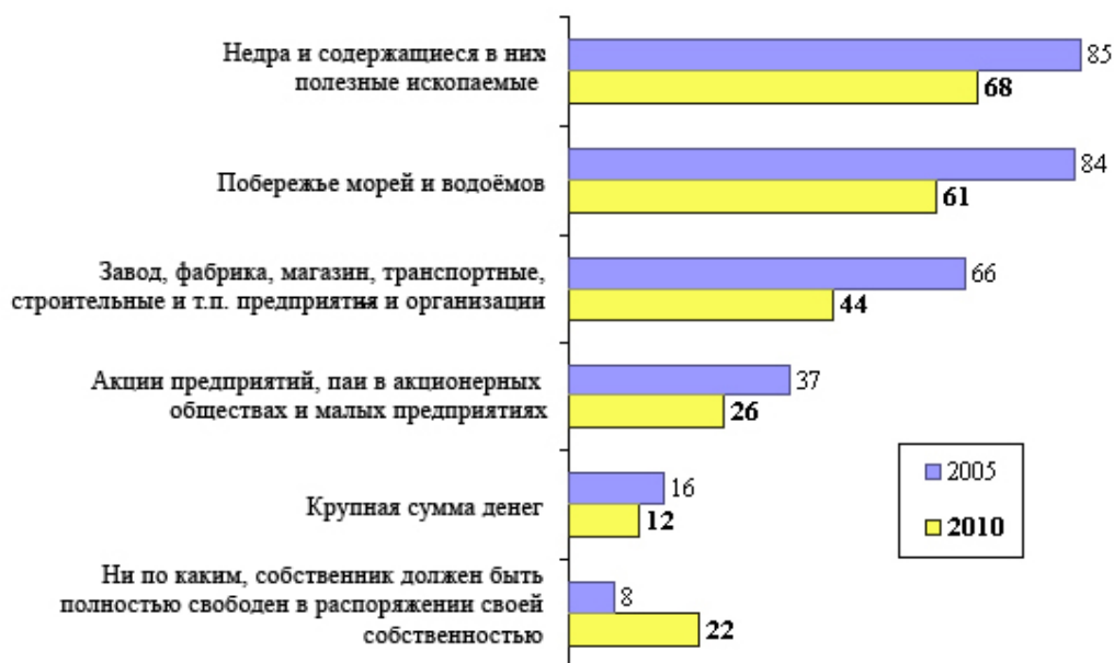
Рис. 5. Поддержка населением права государства ограничивать права собственников по некоторым видам собственности, 2005/2010 гг., % (допускалось несколько ответов)

Подведем итоги. Для россиян характерно ожидание достаточно активной роли государства во всех сферах жизни общества, что отражается в их представлениях об идеальной модели общества и соответствующих функциях государства. Что касается экономической политики, то население выражает устойчивый запрос на ведущую роль государства в экономике, хотя за последние 10 лет его популярность немного сократилась. В социальной сфере роль государства, по мнению населения, также должна быть решающей и ощутимой. При этом большинство россиян ждут от государства обеспечения для всех определенного минимума, а вот чего-то большего каждый должен, по их мнению, добиваться самостоятельно. Такая модель является устойчивой и наиболее характерной для российского общества все последние годы.