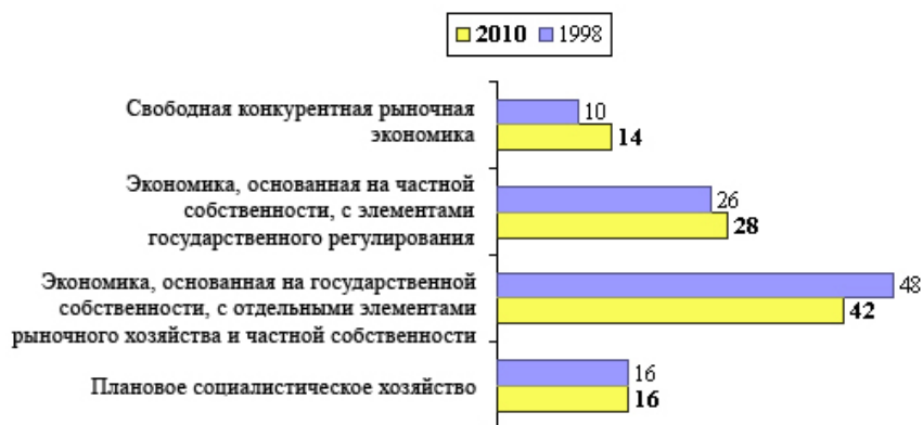
Рис. 3. Каким должен быть, по мнению населения, экономический строй в России, 1998/2010 гг., % (данные по 1998 г. приведены по результатам мониторингового исследования РНИСиНП, проведенного по стандартной общероссийской выборке в октябре 1998 г.)

В вопросе о том, кому должны принадлежать природные богатства страны, наибольшая доля россиян выбрала вариант «народу» (45%). Немного отстает от этого стремления к коллективной собственности на природные ресурсы вариант государственной собственности на них (39%).