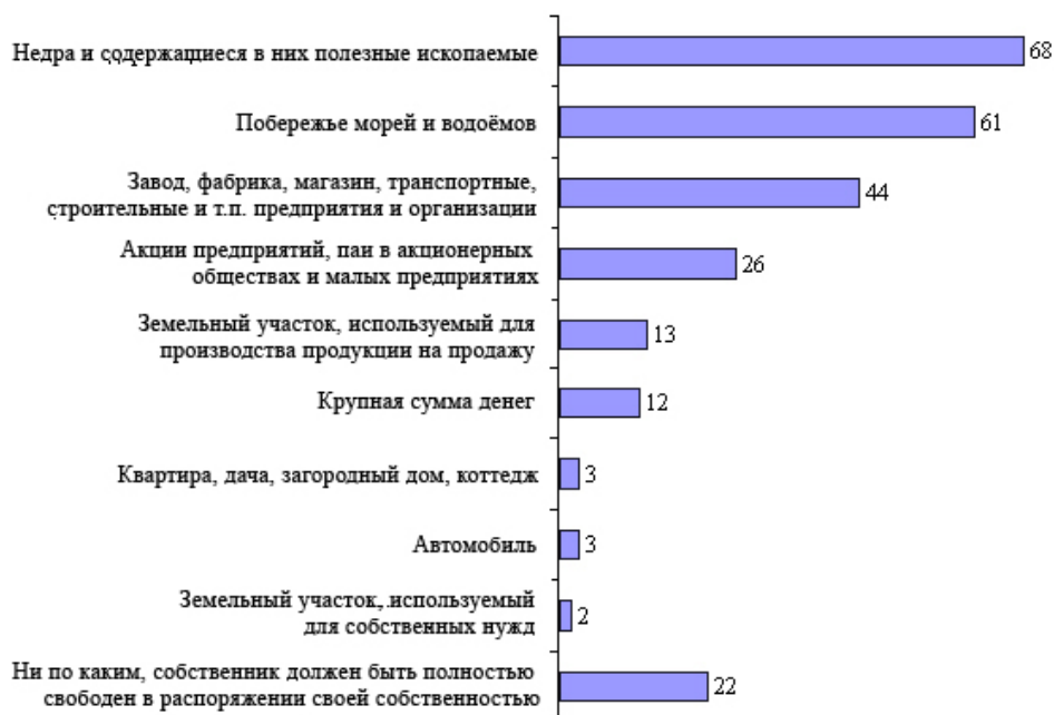
Рис. 4. По каким видам собственности государство, по мнению населения, может ограничивать права собственников распоряжаться своей собственностью (2010 г.), % (допускалось несколько ответов)

Остальные варианты выбирают менее половины населения, тем не менее, цифры эти также очень показательны. Так, 44% считают, что право собственности может быть ограничено государством и по таким объектам, как заводы, фабрики, магазины. Каждый четвертый россиянин считает, что государство может контролировать такой вид собственности, как пай и акции предприятий. Согласие с регулированием государством этих объектов означает, по сути, что вмешательство государства в экономические отношения на уровне отдельных фирм в глазах россиян легитимно и даже востребовано в рамках реализуемой экономической политики.