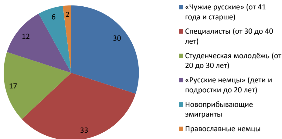
Рис. 1. Соотношение групп прихожан в приходе, %

Стоит сразу отметить, что изучаемый нами православный приход 1 , состоящий из почти 1500 человек, трудно свести только к одной группе. В ходе нашего исследования удалось выделить шесть групп его прихожан (см. рис. 1).